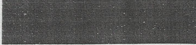
Schepen zijn er nauwelijks te zien in de haven van Rijswijk. Maar

een geringe stijging in ben. Daarmee zijn ze in staat hun fi- nanciële verplichtingen op de lan- ge termijn na te komen. PGGM is de afgelopen maanden tij- delijk onder die 105 procent geko- men. Het fonds bedient in totaal 1,5 miljoen mensen: 950.000 werk- nemers, 400.000 oud-werknemers en 150.000 pensioengerechtigden.