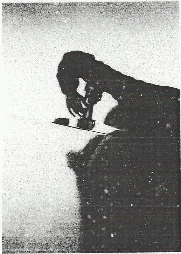
Muziek: vier Italiaanse aria's, de ouverture 'La forza del destino' van Verdi en de samengestelde orkest 'The Adamello Symphony' trad er op voor zowel de bewoners als de buurtbewoonster. Zij wilde met muziek 'licht' brengen in de donkere omgeving van de wijk.